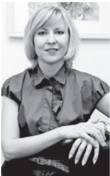
Подготовила ЕВГЕНИЯ ГОРБАТОВА

Магнитка всегда была городом прогрессивным. Причём металлургическая сфера часто «подтягивала» за собой остальные. Металлурги вовсю пользовались пластиковыми картами уже в те времена, когда в других городах о них ещё не слышали. Именно Кредит Урал Банк одним из первых в стране начал внедрение банковских карт, установив банкоматов и процессинговое обслуживание предприятий.